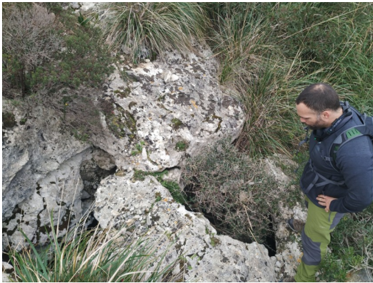
Cova de Sa Paret