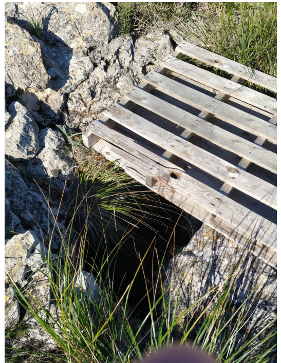
Avenc des Valents tapada con un palet para evitar la caída de excursionistas que pasan por la pista a apenas 1 metro de la boca.

Se requiere del Parc de Llevant su apoyo en dicho proyecto, el permiso necesario para dichas tareas y para poder acceder con vehículos por la pista al Puig de Sa Tudossa.