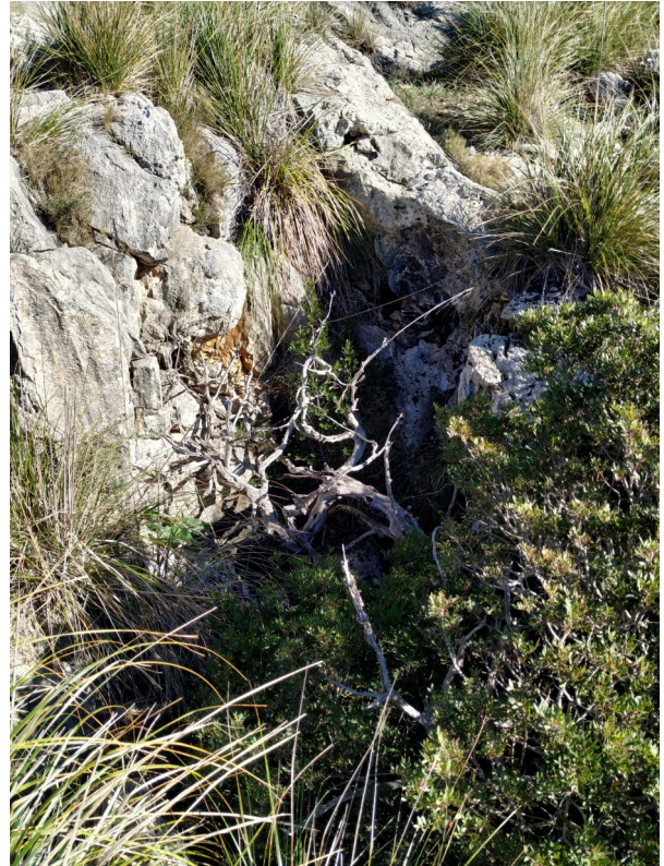
Avenc des Tres Caps cubierta por la vegetación y muy difícil de encontrar.

Las cavidades más cercanas al camino se hallan en la actualidad con la boca tapada con un palet de obra para que no caigan los excursionistas. Se realizaría sugerencias de seguridad de las cavidades para evitar accidentes.