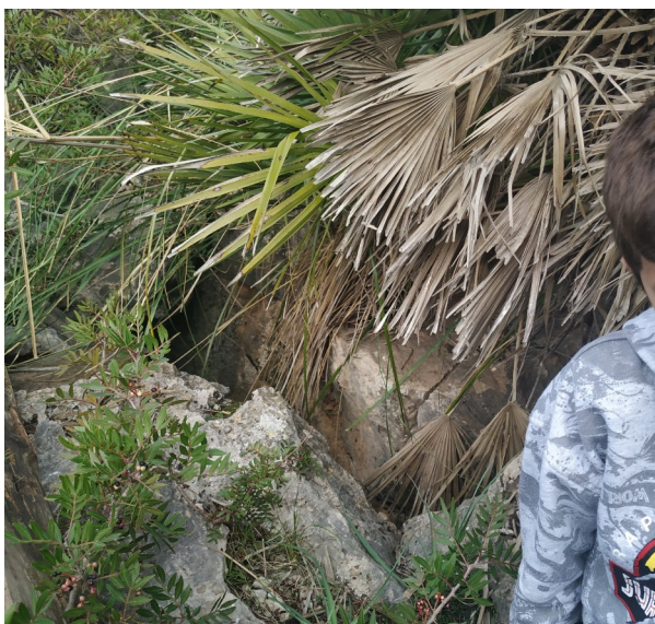
Avenc des Verro, una sima a apenas 5 metros de la pista accesible cualquier excursionista que puede tirar basura o tener un accidente.

En las cercanías de dicha pista se hallan un número importante de cavidades y simas al alcance del excursionista debido a su proximidad y facilidad de acceso. Casi todas las cavidades fueron exploradas hace décadas, la mayoría por el Grup Nord de Espeleología y desde entonces, salvo las más importantes como el Avenc de Travessets, no han vuelto a ser visitadas por los espeleólogos.